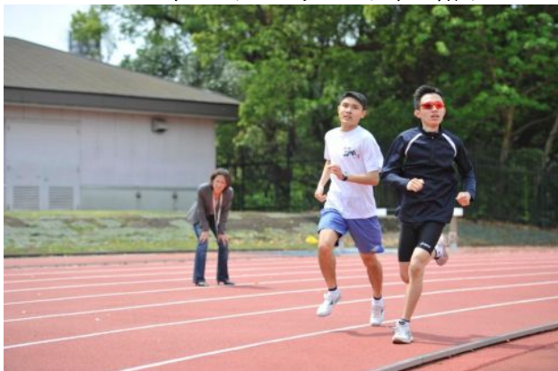
4/30 東京での合宿練習…有森SON理事長も激励