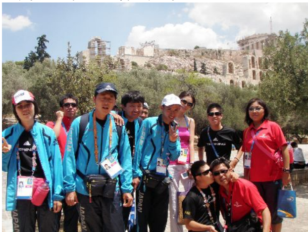
パルテノン宮殿を背景に陸上競技チーム