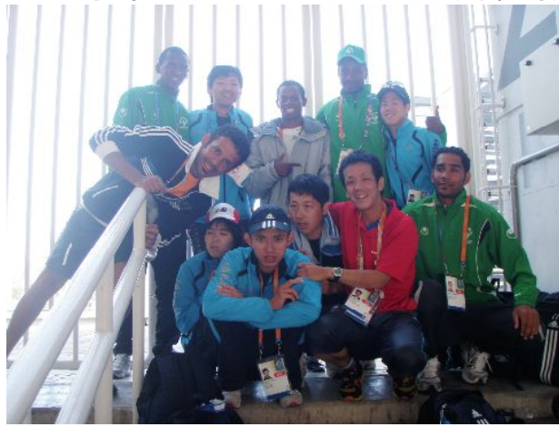
各国選手団とも交流

詳しくは「スペシャルオリンピックス日本」のサイトや当会ブログもご覧ください。 たくさんの応援、ありがとうございました。